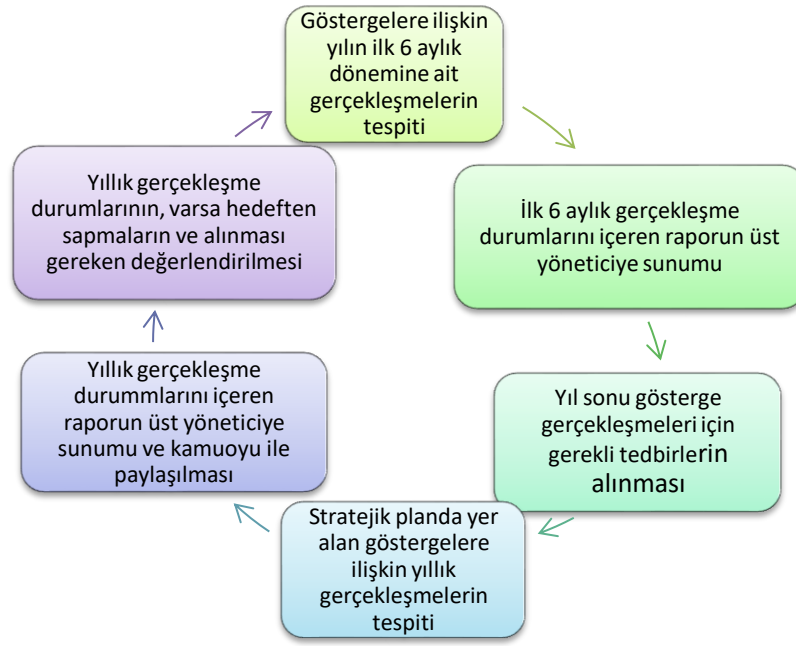
Tablo 32.Stratejik Plan İzleme Değerlendirme Süreci